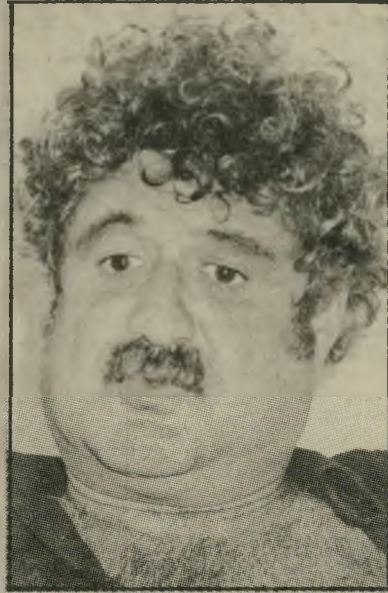
משורר נגד-מילחמה יבוי עדין מפרופסורים שקששנים

כבר בפתיחה, רצוי לציין כי מוכר כאן באנתולוגיה מתפתלת. קרי: אנתולוגיה המנסה לגוּט את עורכיה, בינות למשוררים שונים, תוך מילכוד של קשרים והקשרים בעולם הספרות