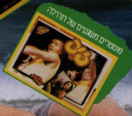
פוסטרים משגעים של תהילה