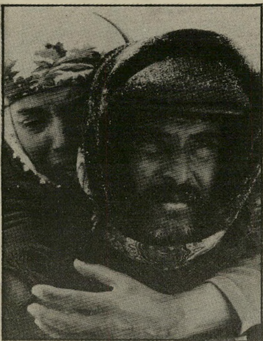
יול תעודה פוליטית

השבוע אישר בית־הדין הצבאי העליון בתורכיה פסק־דין מוות נגד 13 אסירים פוליטיים. בכך יגיע מיספרם של הנידונים למוות ל־22. משקיפים מציינים, שמיספר המוצאים להורג באורח "חוקי" אינו משקף את התמונה כולה. כמו בארגנטינה, צילה,