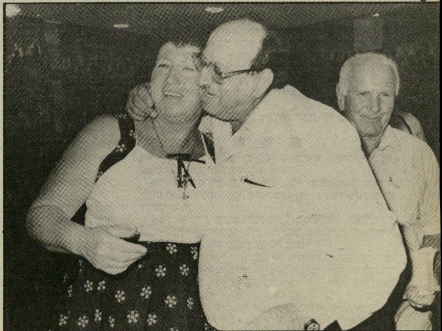
ראש אומריציה ולקר ואשתו הפיכת-חצר

ואם לרייק עוד יותר — הכל התחיל מסניף חרות.