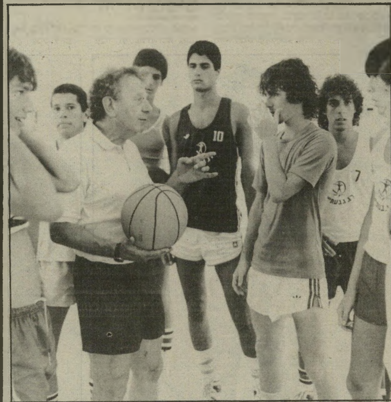
מאמן קסלר עם שחקני הנוער של רמת-גן שידוך טובו

הפועל חולון, שקצרה הצלחה לא מבוטלת בעונה שעברה, החליטה שאם ברצונה להיות בפיסגת הכדורסל עליה לחזק עצמה בשחקן אמריקאי נוסף. כעת זה יתאפשר לה.אחרי שמויך קארטר נשא אשה ישראלית, והפך רשמית ישראלי.