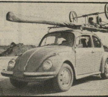
המטוס ארוז המהירות 100 קמ"ש

מהירות שיוט 60 קמ"ש; צריכת דלק 5 ליטר לשעה (מיכל דלק בן 20 ליטר); שיעור הטיפוס 400 רגל לדקה; מרחק המראה 40 מטר. ועכשיו הגענו להפתעת העונה: המחיר. 5960 דולר, בערך כמו שליש מכונית חדשה. ומי שרוצה לקנות וגם ללמוד לטוס, יהיה חייב ללמוד תיאוריה במחיר של 150 דולר, או קורס הכולל תיאוריה ו-16 שעות הרכבה בטיסה ב-800 דולר, פחות מלימוד נהיגה במכונית אחרי שני כישלונות. ועכשיו יש עוד הפתעה: את כל הסיפור הזה שמעתי וראיתי בארץ, למרות המחירים כדולרים. שני משוגעים לעניין הקימו חברה בשם קל-טיס. שיש לה אפילו משרד באזור התעשייה בהרצליה, ורשיון להפעלת מטוסים זעירי מישקל בארץ. ראיתי במחסן כמה מטוסים ארוויים, שאותם אפשר להרכיב בחצי שעה. יש להם מרכז מיבצעי בשדה-התעופה הבריטי הישן בעין שמר, מרייכים, ספרים ומטוסי-הרכבה זוגיים. בקיצור, מי שרוצה להגיע לאילת ולא על