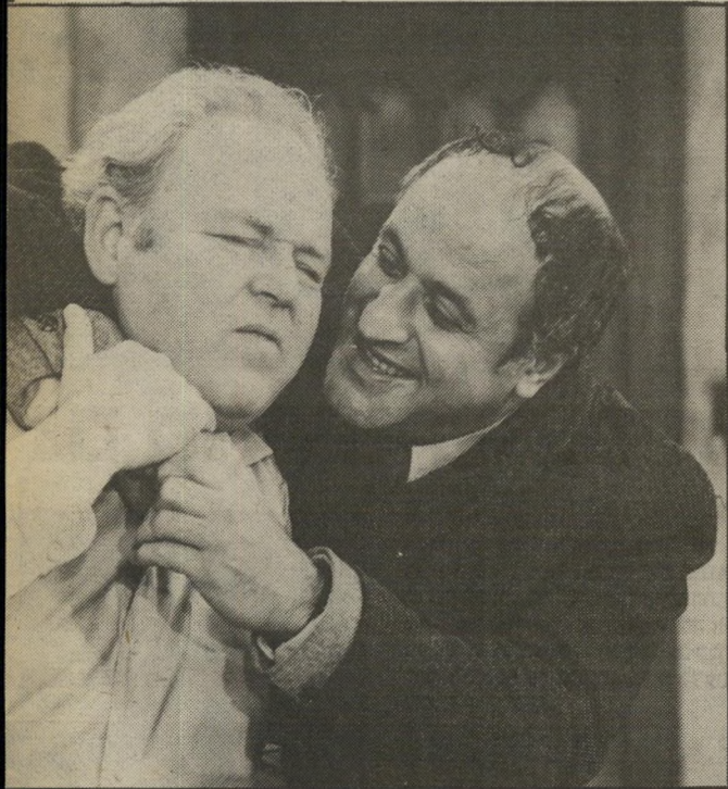
ארצי באנקר. סטראוטיפים גזעניים