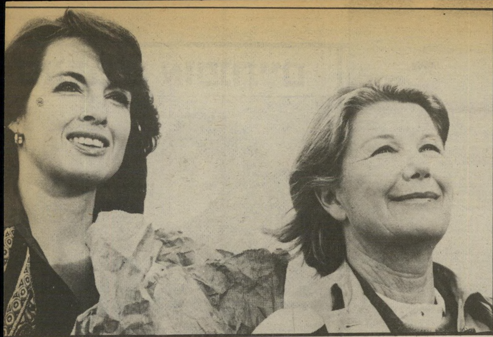
דאלאס. סטראוטיפים של נשים אבודות

אלה שלומדים באוניברסיטה הם בלונרית ואשכנזים, האחים של הבחורה הם פרענקים ואלימים, הבחורה גרה בשכונת-עוני עלובה, הסטודנטים בצפון תל-אביב, וכעת מוצגת הרילמה לפני הילדים: האם האשכנזים צריכים לעזור או לא לעזור לבחורה? האשכנזי הראשון, שעושה