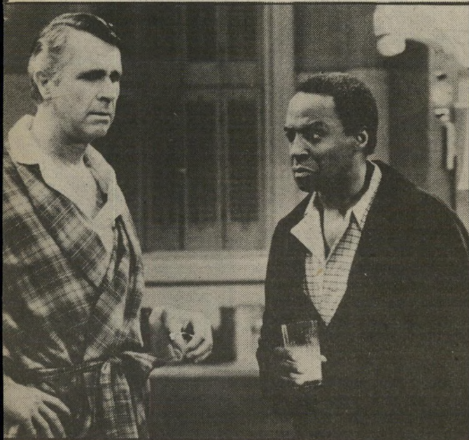
בנסון. סטראוטיפ של כושי מצליח

לא שווה פרוטה בלי ג'וק, כשהוא מת. היא לא מסוגלת לקחת על עצמה אחריות ולקבל החלטה. כשמת בעלה נגמרים חייה. ופאמלה — הרבר היחיד שהיא רוצה זה ילד, והעבודה היא רק תחליף לזה שאין לה ילד.