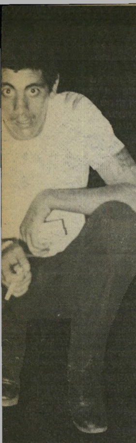
אסיר סוויסה עקרונות בחיים

סוויסה, שהוא כיום בן 32, כמעט ולא ידע בחייו חברה אחרת מזו