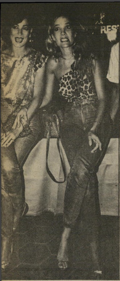
חרעות רגלים הדוגמניות פנו מיר, התיישבו על השולחנות בחוף ועשו פוזו מור ושולמיות א