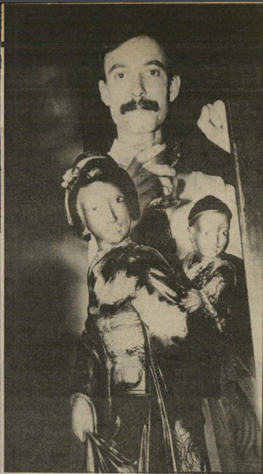
יפאני משווייץ רוברטוס, למד בשווייץ אד" ריכלות. אך בישראל הפך למנ" חל מיסעדות. אני מבין באוכל יפאני כמו כל האירופאים.