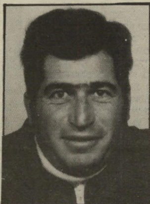
קורא סרסקי ים סוער

תומכי הליכוד, שהתאכזבו מדרכה של מפלגת העבודה, נתנו אמון מלא