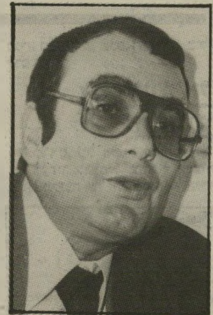
מועמד רום שם דומה