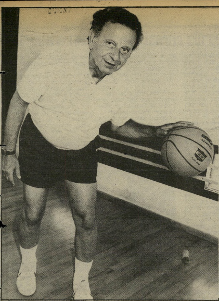
מאמן כדורסל קסלר המום מהישראליות

אנשי הפועל יהוד זוכרים לרוקבן את חסד מישחקו האחרון מול כפר-סבא, ולא יכלו לסרב לבקשותיו. ביתתים הבטיחו לו תנות של רשת טוטר האופנתית במרכז העיירה יהוד. רוקבן לא היה מוכן לשמוע על כך. ביתתים החליטו אנשי יהוד לרכוש שוער נוסף לקבוצתם. זאת, אומרים יודעים דבר, בעשה כדי להוריד לחביב השחקן את האף, ובאותה הזדמנות גם לרוקבן.