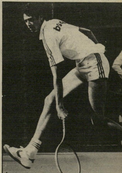
טניסאי פרקים מופנם

כאופיו של שחר קיימים ניגודים רבים, המאפשרים לו להגיע לאן שהגיע עד כה, מוסיפה האסטרולוגית לפרט. שחר פרקים ניהן במישמת עצמית גבוהה, בשאפתנות — שקטה