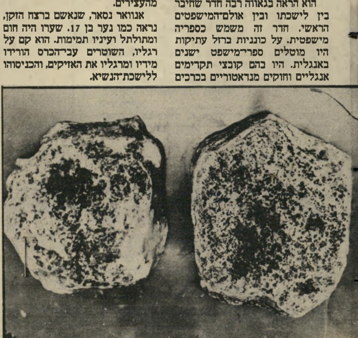
נשק הרצח אבנים מקומיות

אנוואר נסאר, שנאשם ברצח הוקן, נראה כמו נער בן 17. שערו היה חום וגתולת ועיניו תמימות. הוא קם על רגליו ומרגליו את האזיקים, והכניסוהו ללישכת-הנשיא.