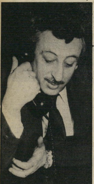
פרקליט מקרוין האורח נאשם

הבעל סירב למסור את מפתחות הדירה, כדי שאפשר יהיה להעדיף אותה ולהאריזה לקונים. עורך-הדין ביקשו בעתירה בבית-הדימהישפט העליון לרשות את ביצוע מכירת הדירה עד להכרעת הדיון בבית-הדימהישפט העליון. אולם השופט שלמה לוויין ראה עתירה זו, ונתן הוראה למכור את הדירה מייד.