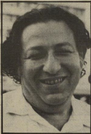
קורא סלע שלוש פעמים

איש יחסי-הציבור מגיב על אחד הפרטים בניחות שבי