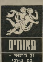
21 במאי - 20 ביוני