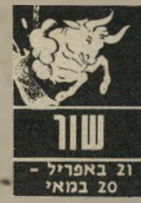
21 באפריל - 20 במאי