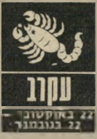
22 באוקטובר - 22 בנובמבר