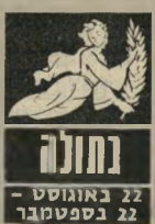
22 באוגוסט - 22 בספטמבר