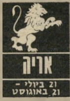
21 ביולי - 21 באוגוסט