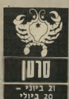
21 ביולי - 20 ביולי