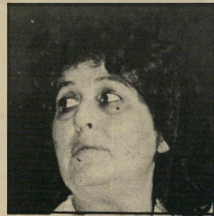
הח"כית מן הימין הקיצוני גאולה כהן ביקרה את ברציון בכלא והשתדלה למענו.

כי ייגוד דיומויות על הנכה שהרג את אביו, האיש שגור את דינם של אחרים למוות בבית-המשפט הצבאי, החליט לעשות הכל כדי לצאת מהר ככל האפשר לבית-הסוהר — ולא לשלם את הקנס.