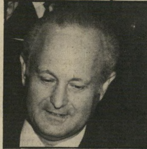
נגיד בנק ישראל, משה זנבר, הזרים סכף רב לבנק הכושל, והאשימם בכך את ספיר.