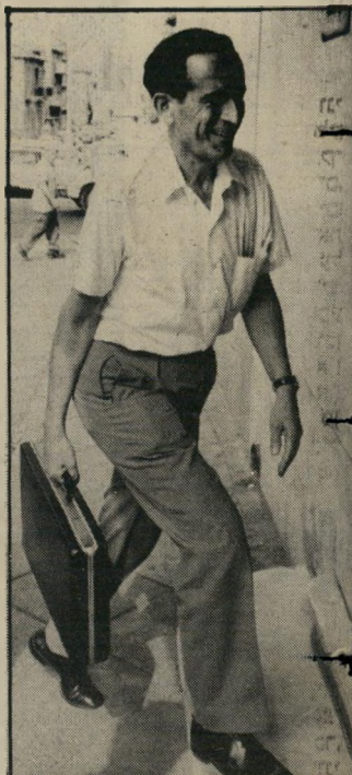
שותף מירון ירושת האב

באורח אירוני, היתה גניבת הענק של הבנקאי הלאומני אחד