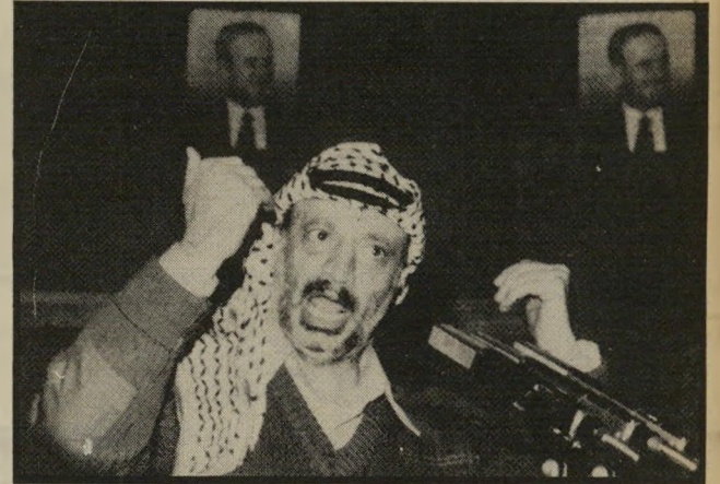
ערפאת לפני תמונת אסד לנצח או להירצח

אחרי שיאסר ערפאת קיבל בארץ ערבית מישלחת ישראלית. הובא הדבר לדיון במוסד העליון של פתח. לתדהמת ערפאת ואנשיו, הסתבר בישיבה זו כי בפת"ח התגבשה בינתיים קבוצה קיצונית, שהתנגדה בחריפות לפגישה זו עם "ציונים" ולכל הקי המתון שגיבש בבירות. היה ברור כי הסורים החלו חורשים בתוך שדות פתח, ונדלק אור אדום.