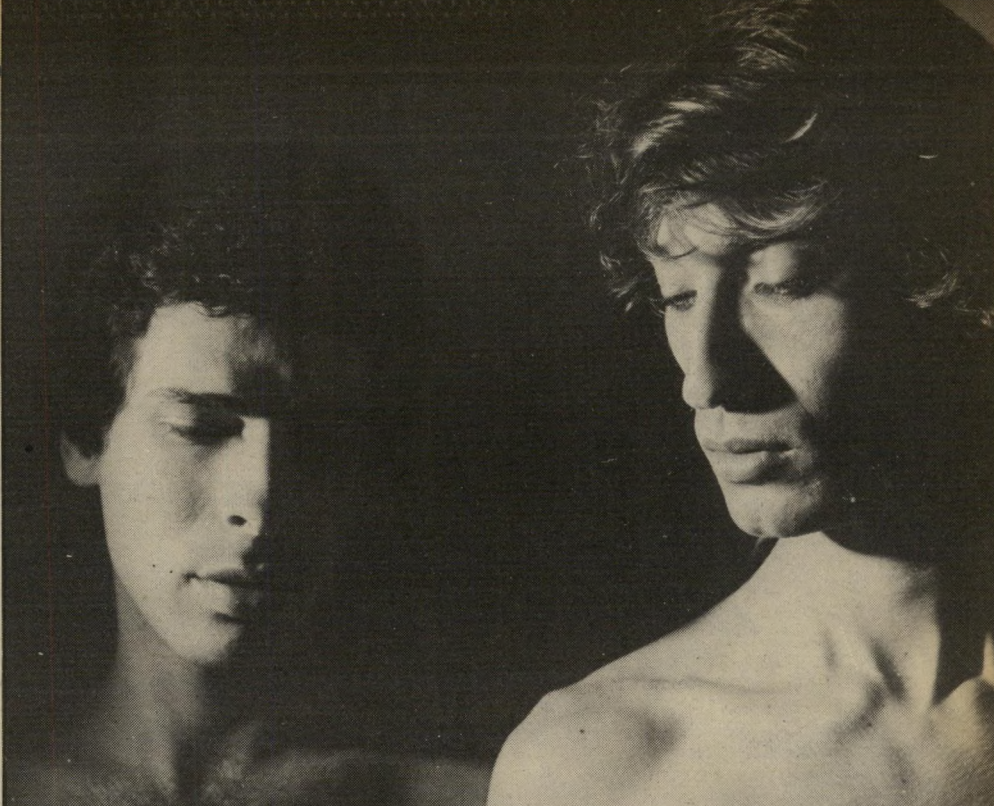
שחקנים עמר ורוט בסרט "צל אחר". הומואים יש בכל העולם - אך לא בישראל!