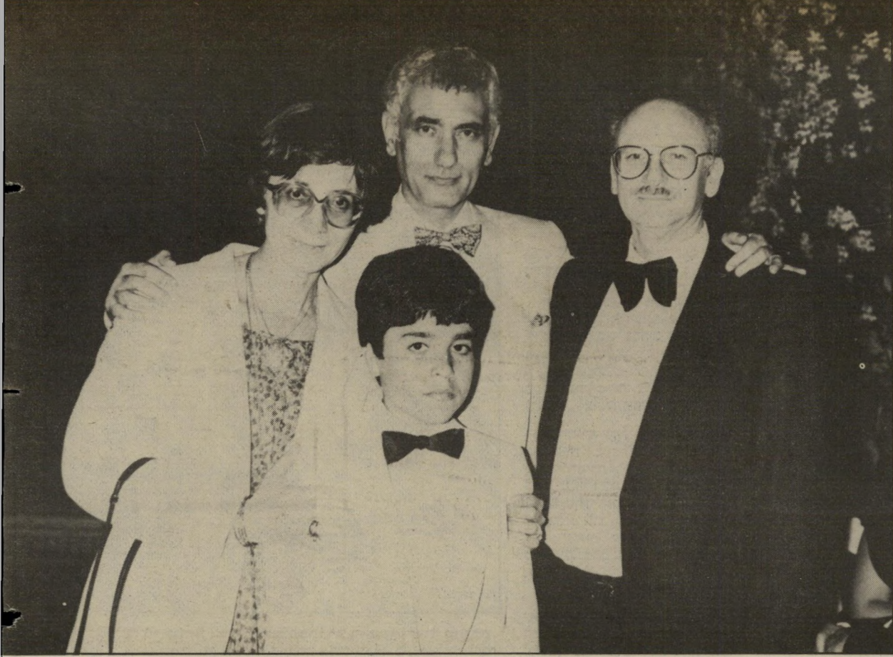
הבימאי אילמו גוני והילד המשחק בתפקיד הראשי בסרטו "החומה" בפסטיבל קאן 1983* קאריירה מזרח בין מזרח ומערב

באמצעות יול יעשה חלק גדול מן הקהל הישראלי את היכרותו הראשונה שלו עם התסריטאי-בימאי אילמו גוני, כיום אחת הדמויות הבולטות בקולנוע האירופי. אמנם, היו כבר הזדמנויות קודמות לערוך היכרות זאת. כי כמה מסרטייו של גוני כבר הוצגו בישראל, אולם הם הוקרנו באותה מיסגרת מוגבלת של סרטים