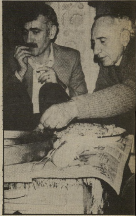
גוני עם הבימאי איליה קאזאן המלך המכוער

אחד מאנשי הרוח האופנתיים, שאותם נוהגים להזמין בזמן האחרון כדי שיביעו את דעתם ככל