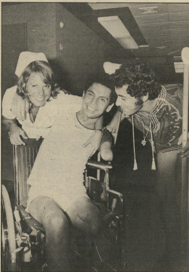
בבית החולים בצפת, שאלו הועבר מייד אחרי פגיעתו במוצב כרמלה שברמת-הגולן. מעוזיה הגיע לבית החולים במצב של מוצר מבית-החרושת לבשר של ויכרד לוי, בהגדרתו. הוא הפתיע את הרופאים ואת האחיות בהחלטתו המהירה.

אני זוכר אותו יושב רגל על רגל וכותב, כשפתח השחפ"ץ שלו, למולו הרע, מול פתח חדר-האוכל. הוא חטף רסיס ישר בלב ומת על המקום. אני הרגשתי שאני עץ. האווניים ציפצפו לי וראיתי הכל שחור. לא איכרתי את ההכרה, למולי, ואני זוכר שלא הבנתי למה אני לא נכנס לפאניקה, כי הבנתי