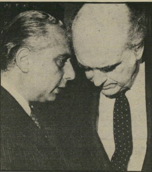
פאפנדריו עם נשיא קפריסין קיסריאנו תורכיה לחוד ונשק לחוד

אבל לדרישותיו האמיתיות של ראש-ממשלת יוון אין כל קשר לאידיאולוגיה. פאפנדריו רוצה נשק, ובכמויות גדולות, מארצות-הברית, כדי להרתיע את התורכים מתוקפנות כלפי