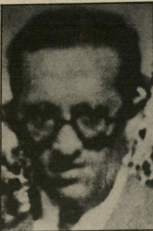
מנהיג ארלוזורוב אישיות במפא"י

מקדם את הספורט בישראל? מקדם. או אני שותף? לפני מישחק בין בית"ר ירושלים והפועל תל-אביב נשמעו קולות צהלה ברחובות הבריה: