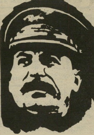
רוזן סטאלין צנוע מיורשיו

המנהיגים הסובייטיים מניסו להשיג את יוסף סטאלין - וכמה שיותר מהר. הרוזן הסובייטי סטאלין, שהטיל אימה על מאות מיליוני בני-אדם, נשא רוב ימי חייו בתואר צנוע: המזכיר הראשון של הוועד המרכזי של המפלגה הקומוניסטית. רק אחרי 20 שנה הוסיף לו גם דרגה צבאית נוצצת: גנרליסימוס.