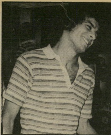
כדורגלן קורט איזה מין חוק

במיקרה שקרה עכשיו, בהחלט יתכן שאוהד של הפועל מרמורק, שהיא יריבה מושבעת של מכבי שעריים, לקח אוהד מתוסכל של שעריים, ושיכנע אותו לקנות שחקן של הקבוצה היריבה במישחק קריטי כזה כמו שנערך בין שעריים והפועל חדרה על העלייה לליגה הארצית. אחר-כך, כששעריים מנצחת, יכול לבוא אותו אוהד של מרמורק ולהוציא את הסיפור החוצה. כך הוא יכול לפוצץ את המישחק ולהוריד את