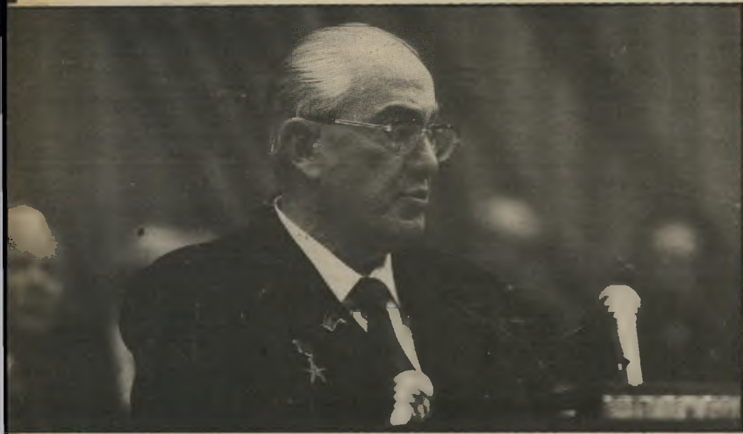
נשיא אנדרופוב תסביך הגנה קיומי-פסיכולוגי