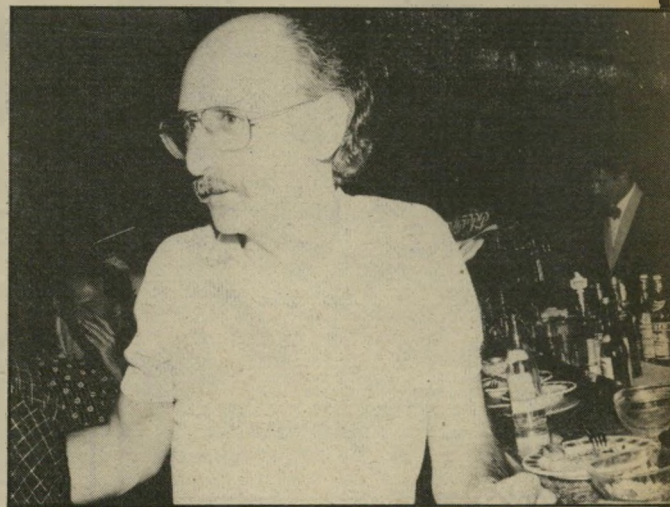
פיטר בן ה-49 בא האחרון לקוקטייל. הוא נחת הישר ליד הבר והזמין ג'ין-טוניק, מיעט לדבר ולהצטלם, והודיע על עזיבתו של פול לארצות-הברית. הבקשה היחידה של עורכי הקוקטייל היתה שיאות לחתוך את העוגה שהוכנה לכבודם. רק אחרי בקשות ניאות לחתוך אותה.

ה שבוע נחתו בישראל חברי אשלישיית זמרי-העם הפופולארי פיטר פול ומרי. הם הומנו על-ידי קרן תרבות ירושלים, לקונצרט אחד ויחיד בכריכת הסולטאן. אחרי שהגישו קונצרט בן שעתיים