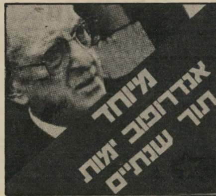
יומן השבוע, 17.6.1983 מה עם השני?

או שרהבריאות, שיותר מכל אדם אחר, פשוט בתוקף תפקידו, אחראי לכך שפצע מוגלתי קטן במדינת ישראל רהיום זה סכנת מוות, כי או שתמצא רופא או שלא תמצא, או שיהיו לך 900 שקל או שלא יהיו, ובינתיים הפצע המוגלתי