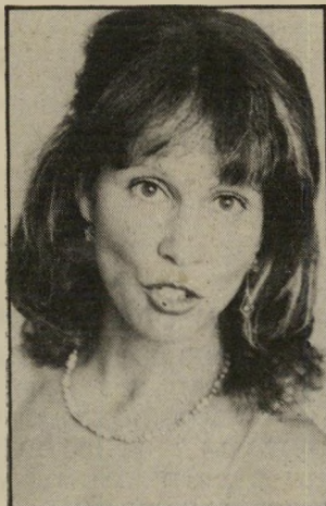
קוראה גריב יוון בתל-אביב

אחד מבריוניו של מאיר כהנא נשלח לקורס בצה"ל, שבו ישלל את שיטותיו (ראה כותרת "הארץ" 13.6.83).