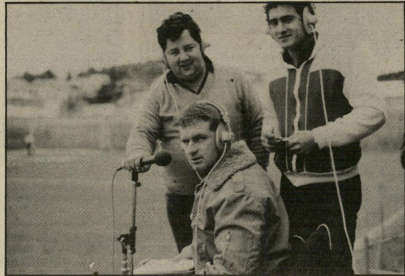
טכנאי-שידורספורט פייסיק (באמצע) עניין של כף

הגמרדרבי על גביע המדינה בכדורגל, התחיל כשעה וחצי לפני מישחק הכדורסל של נבחרות יוגוסלביה וישראל, בעיר נאנט