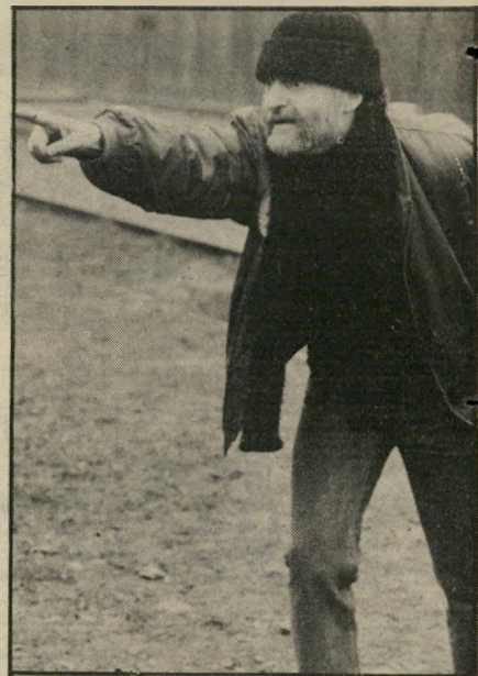
בימאי פאל שאנדרור פרס הביקורת

שמונה או על-ידי הסובייטים להיות מנהיג הונגריה, והוא עדיין יושב באותה המשרה — יאן קאדאר.