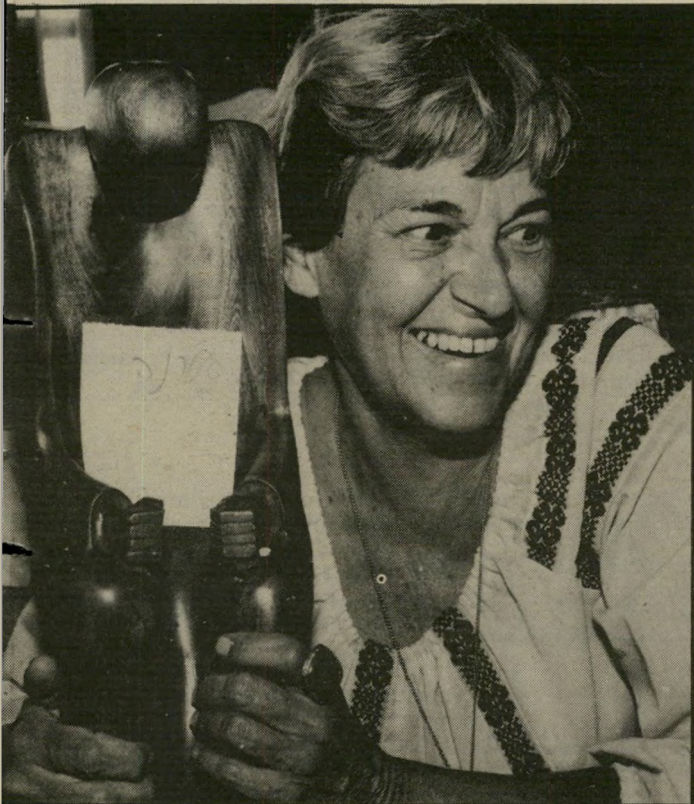
השנה של אורנה אורנה פורת, שקיבלה את פרס ישראל, אוזנת בפסל שקיבלה במתנה מנחום שמיר. את הפסל עשה נחום אחרי שראה את ההצגה נשי טרויה. הרעיון של ישיבה על הבימה לקוח מתוך ההצגה.

אני רוצה להיות כמה שיותר נבית, היא אומרת, ולכן החזרת נערכות אצלי.