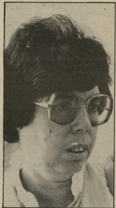
משוררת הרניק הלחך — זכור את הבית השלישי

שלו היו / עינדך בני חזוית / הגבות שלך / ושלי. הילד שאל / איפה אבי? / אבך, ילדי, נישא ברח / ההר. בארץ נכר / נשאר אבך, ילדי. / מישהו טעה. בני היפה / ועכשיו אתה לא תהיה. // איפה אבי שואל הילד / שלא נולד