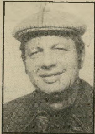
קורא אמיד לחם ושעשועים

יום אירוד, האיש שלו כלנו חייבים תודה על הצבע, הצליח למלא