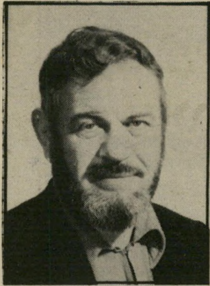
קורא שלשקם שכר ממוצע לרופא

פיתרון לשביתת הרופאים (העולם הזה 2386). הסיבה להמשך האינסופי של שביתת הרופאים שקופה לחלוטין: ההסתדרות אינה יכולה להרשות לעצמה לשלם משכורות גבוהות יותר לרופאי קופת-החולים, מבלי ליקר את השרות (רוב ההכנסות של דמי-החבר בהסתדרות מופנות למטרות אחרות, כעיקר פוליטיקה ומיסחריות). המ"ד שלה מצדה מעוניינת לשכור את