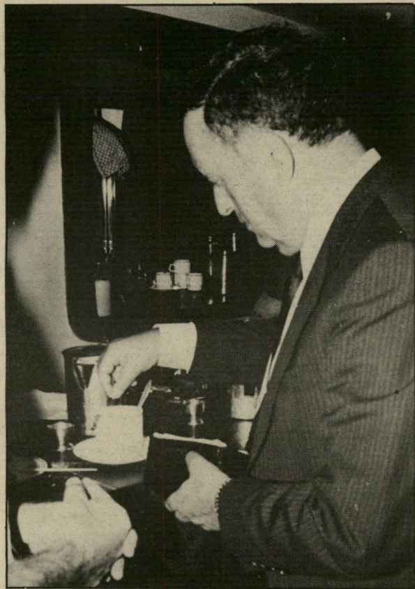
מנחם סבידור יו"ר הכנסת, הגיע השבוע לתיאטרון הבימה להצגת בכורה של ידיים מזוהמות". בעת ההפסקה ירד סבידור לפואייה של האולם והזמין לעצמו כוס-תה. בתמונה נראה סבידור כשבדור האחת הוא מוסף ממתיק מלאכותי לכוס-התה, ובידו השניה מחזיק את ארנק-הכסף שלו. סבידור לא שוחח עם איש בזמן ההפסקה, וכשזו נגמרה עלה בחזרה לאולם. בגמר ההצגה הלך סבידור ולא נשאר להשתתף בקוקטייל שנערך לכבוד הצגת-הבכורה.