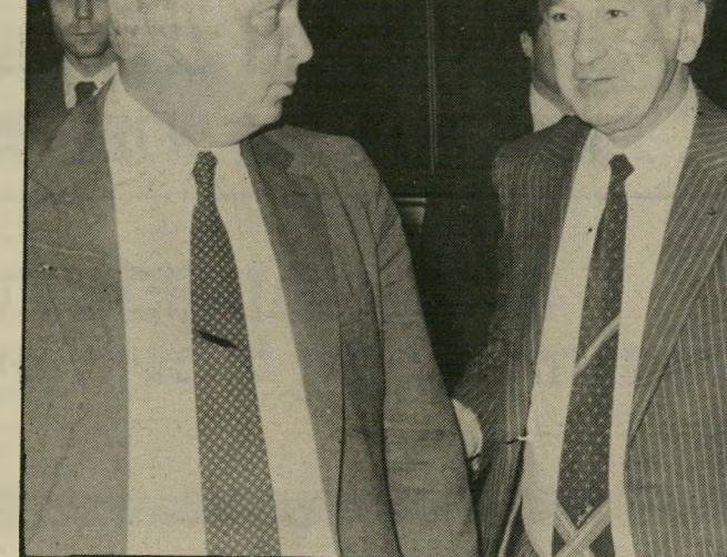
שיף עם שרון השר החביב

דוגמות תל-אביביות: הרור' גמה הירועה ביותר עד כה היא זו של מלון דיפלומט. שיף החליט לשנות