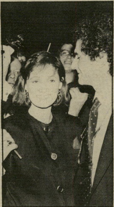
ללוש עם בואי זוג במציאות

התפרצויות-הזעם שהיו תוקפות אותה מדי פעם, היה משיב ברעמי-צחוק שהיו מפיגים את כל המתח. היא, מצידה, רצתה להיות האשה הקטנה שדואגת לו בכל פרט ופרט. היא נהנתה מן העובדה שהוא היה אפילו יותר מפורסם ממנה, והיתה מסתרת בצילו.