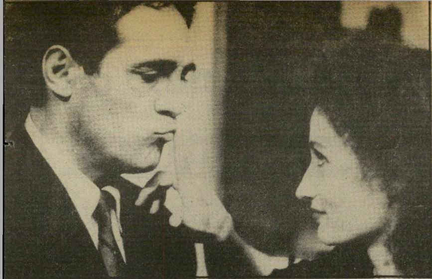
מארסל סרדאן הבן ואוולין בואי ב"אדית ומארסל" נאהבים בקולנוע

"זאת אמורה להיות הפקה בינלאומית, שצריך לצלם בכמה ארצות, ביניהן גרמניה, יוון ואנגליה. אם נמצא כאן את התנאים המתאימים, כמוכן שנעדיף לצלם כאן את אותם הקטעים הקשורים בישראל, אבל שום דבר אינו ברור עדיין." הוא מוסיף, כדי שאיש לא יכבול אותו בהתחייבות כלשהי.