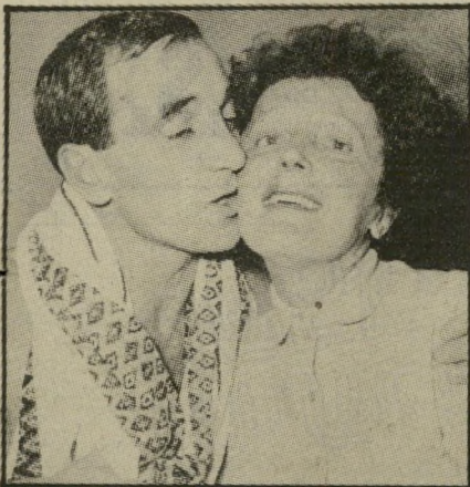
אונאבור עם סיאף ידידים במציאות