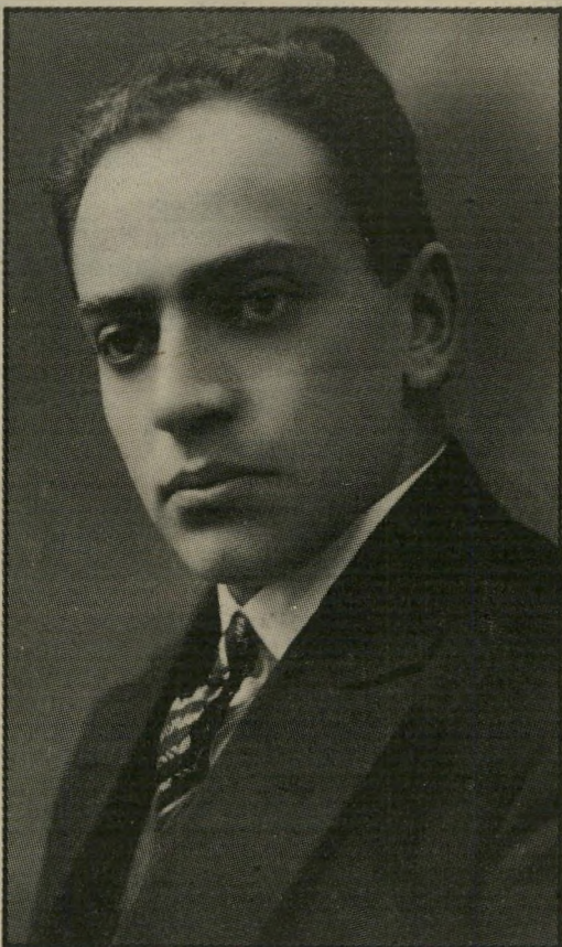
בגילגול הבא אשחק אולי את המלך שקורה היום בהבימה, לא נראה לו שאומנם יצליח.