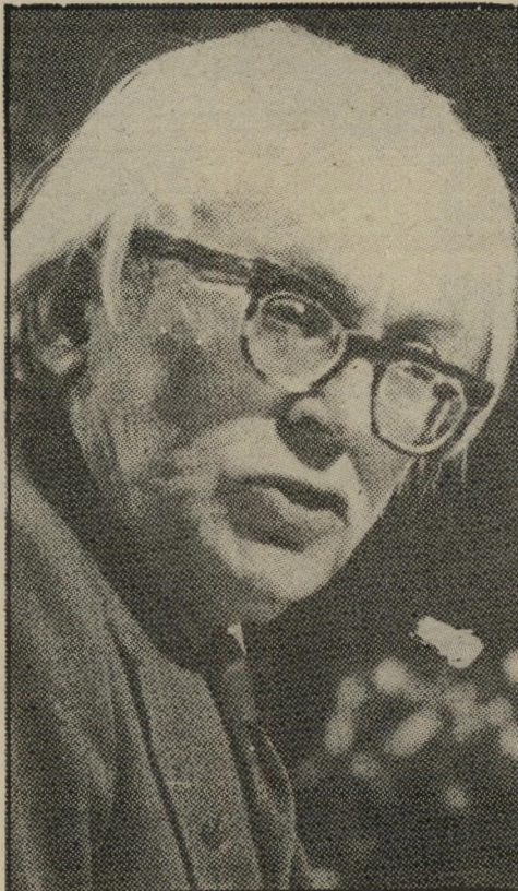
מנהיג לייבור פוט

אין ספק שמנהיגי המערך, הליבראלי רייזויד סטיל והסוציאלי-דמוקרטי רוי ג'נקינס, ירשו שינוי במצע