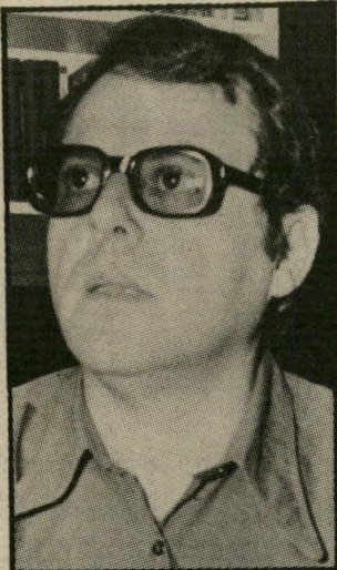
קורא פרי הכל פתוח

בנמר של נייר קראתי רשימה המתיימרת לעסוק בסיפרי קריאת