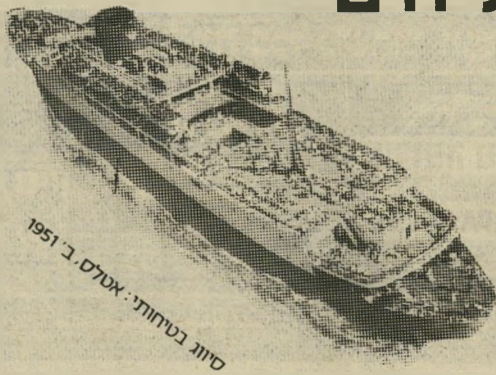
סיווג בטוחות: אטלס. ב. 1951

שייט באונית פאר, נוף מרתק של מים ושמים, 6 ארוחות ביום (גם מזנון חצות), סיפוני שיזוף, קאזינו, סאונה, 7 סיפונים, קוקטיילים, דיסקוטק, קולנוע, שעורי התעמלות, 3 בריכות שחיה, בינגו, תזמורת, צוות הווי, נשף תחפושות, משחקים, חנות פטורת-מכס, מספרה מיזוג אויר מלא בכל התאים.