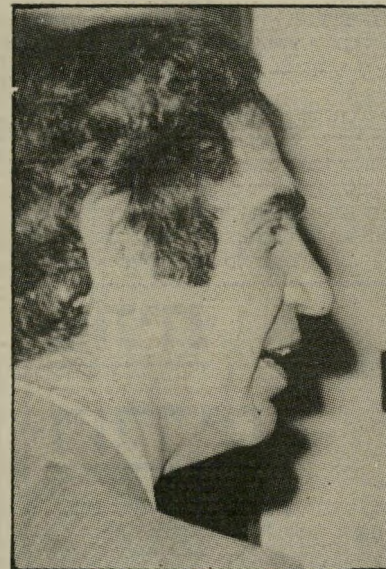
פירווסאיי אדמוני חוברת חנינם

מצבה האנוש של הפועל ירושלים, אמרו השבוע מקורבי הקבוצה, מציין במרויך את