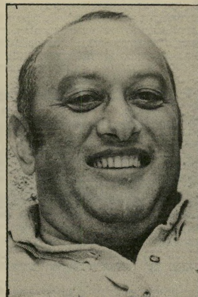
יו"ר מנרל התעייף מהכדורגל

בשביל יו"ר האגודה, ברעם, מעבר מהפועל לכית"ר זה מעשה בגידה חסר-כפרה כמעט. היו"ר הודיע נחרצות לשחקן שהוא מוכן לוותר עליו