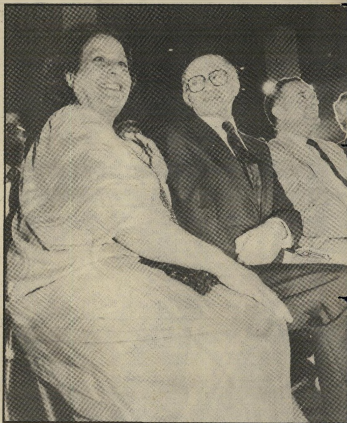
אינטגרציה מנחם בגין, יוצא פולין והזמרת ברכה צפירה. מן העדה התימנית. צפירה הגיעה למקום באיחור. היא היתה עליזה מאוד וכשהגיעה רצה מייד אל בגין ונישקה אותו על לחיו.