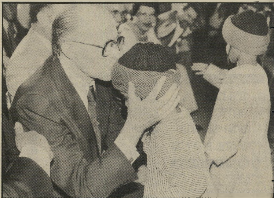
גם אני! אחרי שניגשו שני הילדים בני החמש ושש לראשיה הממשלה וקיבלו ממנו נשיקה. הלכו אל ראש האופוזיציה שימעון פרס, שישב בסמוך, וזכו לנשיקה גם ממנו. הילדים נתנו קטע מרענן ומשעשע של ריקודים תימניים מסורתיים.