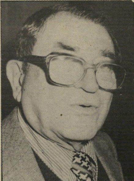
פורש שילה - תככים