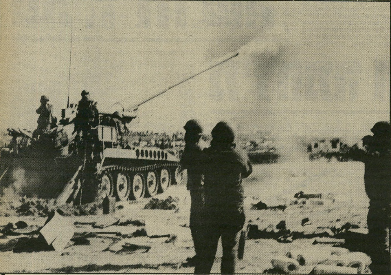
מילחמת יום-הכיפורים ברמת-הגולן לקבל מידע על הטילים הסובייטיים

משום-כך קשה לדעת איך יפול דבר. החששות של הציבור והאמהות היו מוצדקים.