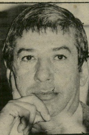
קורא ותד שיחות טלפון

ובכן, לא סירבתי להיפגש עם סרטאוי. ניהלנו כמה שיחות-טלפון, במטרה לארגן פגישה באירופה. אין ברעתי לגלות כשלב זה את פירטי השיחות, אך דבר אחר אומר: לא