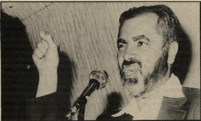
בעלי-זקן בהנא - כזקנו

לא פעם אנו קוראים בעיתונים על אנשים שבאופן מיקרי, או על-ידי התחזות, עוסקים במיקצוע האמרגנות ו/או ההפקה הבימתית, אשר מואשמים בעבירות פליליות. משום מה, בדרך-כלל מתלווה לשם התואר "האמרגן" או "המפיק". בימים אלה נתבשרנו על עוד מיקרה של מתחזה, שנתפס והואשם,