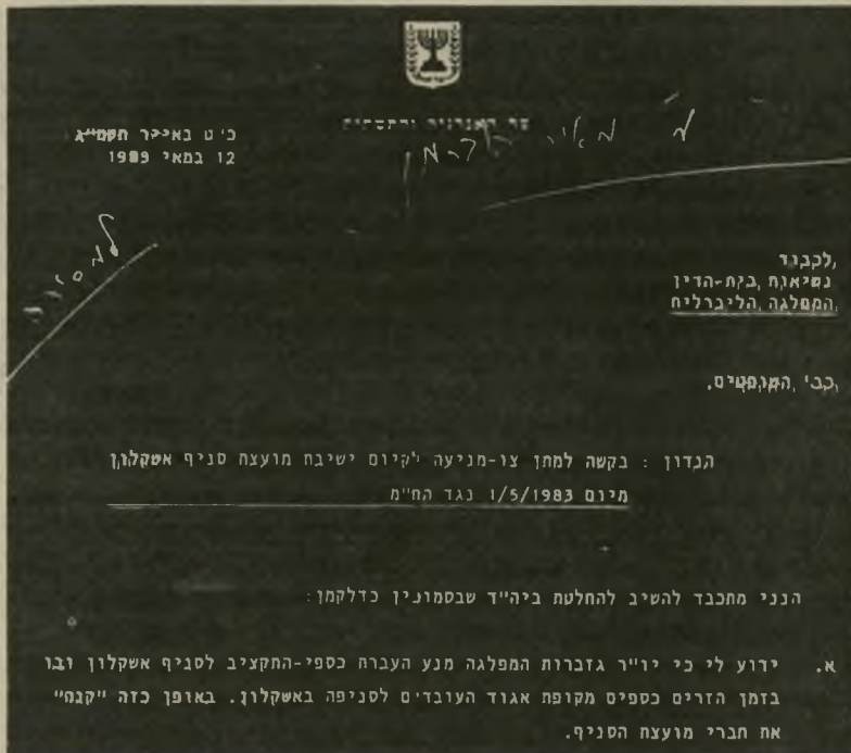
לכבוד נשיאות, בקת-הדין המפלגה הליברלית

את רנר תקף מודעי בגלוי. בהתחלת מאי עשה השר מודעי שימוש מעניין בנייר המיכתבים הרישמי של משרדהאנרגיה והתשתית, שהוא עומד בראשו. הוא שיגר על נייר זה מיכתב אל נשיאות כיתהדין של המפלגה הליברלית, שמנע את כינוס מועצת סניף אשקלון של