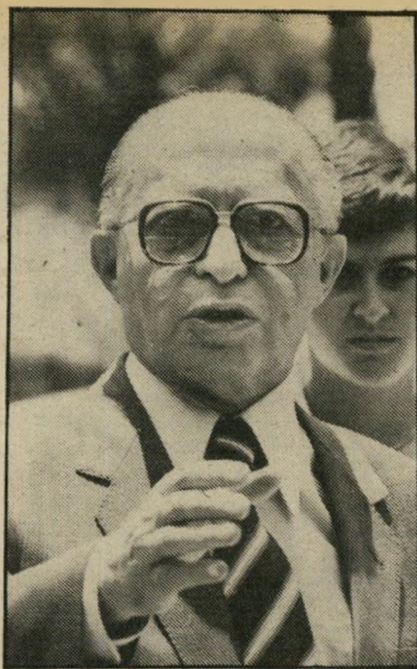
ראש-ממשלה בגין בעיות סבוכות וקשות

הבורסאות זו נזכיר לכם, שלפי חוות דעת של 15 פרופסורים מהאוניברסיטות של תל-אביב וירושלים, כולם מלמדים כלכלה, הדולר הוא עדיין זול, וכי אנחנו שלא נפנה בזול בשאגיוזבר הוא דונאלד רגן, שרי-אבנר של רונאלד (רני) רגן?