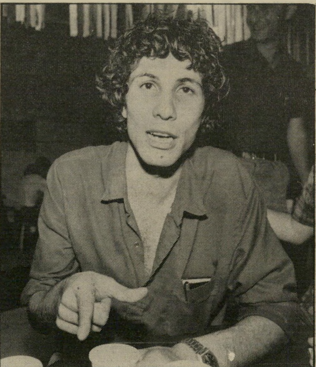
המבאייניק שנכשל ישראל ברבסט, יליד בית-שאן, היה מועמד ליו"ר הוועד וויתר על מועמדותו, כשהתברר שאין לו סיכוי מול קואליציה הכוללת את אנשי תמ"י וועד הסטודנטים הערביים.